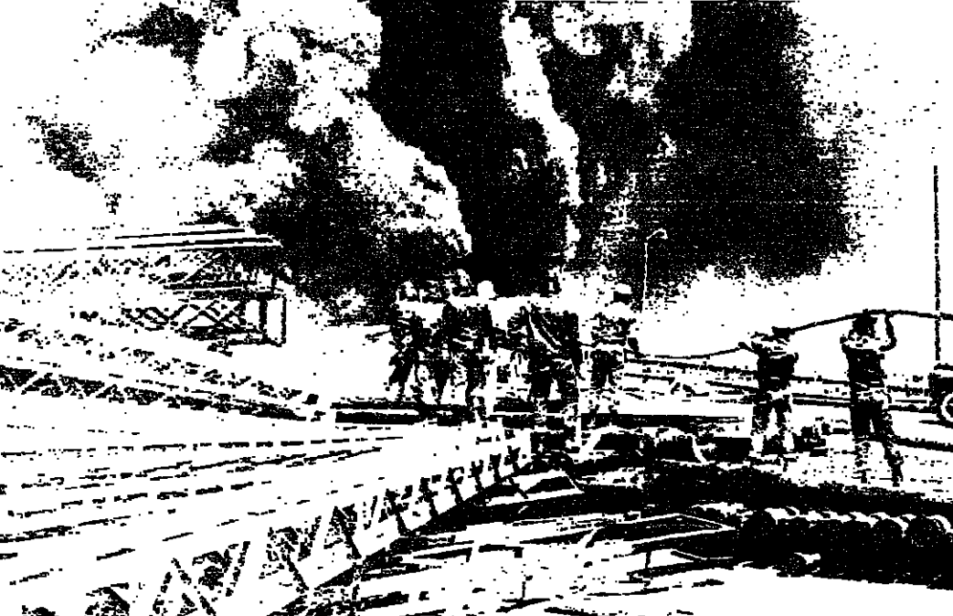
رجال الاطفاء يعملون على اخماد النيران ، وقد امتدت سحابة سامة من الدخان الاسود